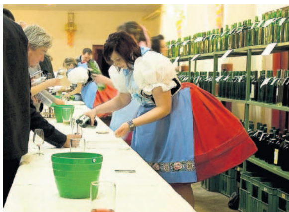
Košť vín v Lanžhotě V sobotu se místní vinaři opět sešli u degustace.