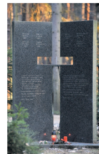
Památník zastřeleným Němcům v Novém Boru.