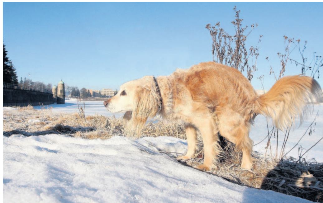
Psí záchod u přehrady Okolí jablonecké přehrady často připomíná psí toalety.

„I proto jsme v neděli uspořádali výchovnou akci Pokuty se nebojíme, po pejskářích uklízíme. Chtěli jsme pejskaře upozornit, že strážníci vyrazí od března do ulic a budou pejskaře pokutovat, pokud po svých čtyřnohých kamarádech neuklidí,“ konstatovala majitelka