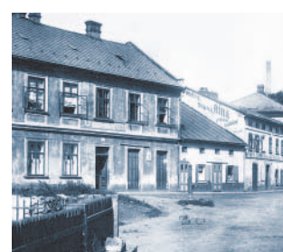
Za první republiky Snímek z Městského muzea ve Dvoře.