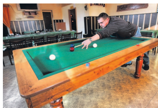
Na Slovanech První zmínky o královédvorské pivnici sahají do 70. let 19. století. 3xFoto: Ondřej Littera, MF DNES