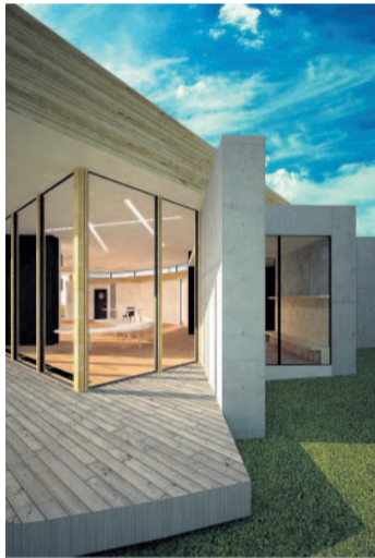
Přímo na zahradu Školka v Arnoldově vile má rozlehlou zahradu. Z navrhovaných přístavek dětí vyběhnou rovnou na travu.