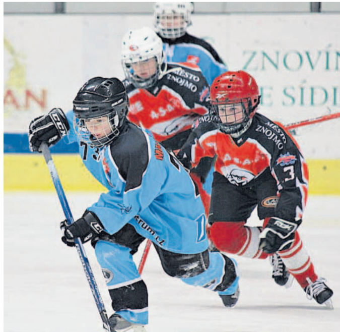
Souboj o puk Malí hokejisté sehráli na znojemském ledu turnaj.

Indián TJ Sokol Bzenec uspořádal v kulturním domě pro děti maskární karneval se soutěžími.