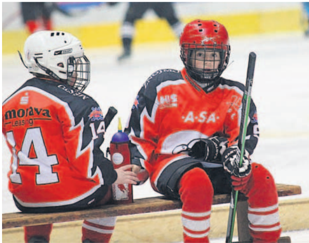
Přestávka na občerstvení V pondělí 21. února se mezi sebou ve Znojmě utkali mladí hokejisté ze třetích tříd.