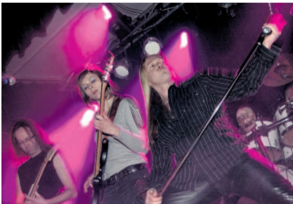
Název Koncert kapel se odehrál v Pěnčíně u Turnova a skupiny předváděly dobrou show.

MF DNES přináší čtenářské fotografie z internetového fotoalba rajce.idnes.cz. Tentokrát jde o snímky z koncertu kapel Scelet, Motorband a Citron