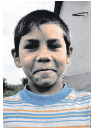
Co s Romy? Tuto otázku nejvíce řeší na severu kraje.

Výsledkem jsou do detailu připravené projekty, které čekají na schválení a přidělení dotací. „Jde o vybudování nového nízkopraho-