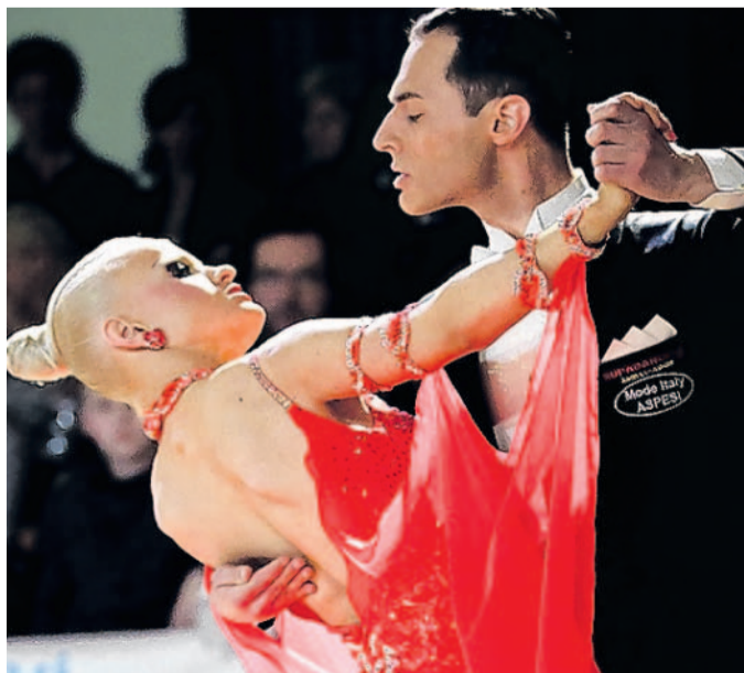
Mistrovství republiky mělo několik kategorií od juniorů po seniory.