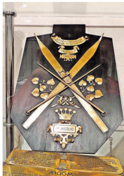
Z Bucharových časů Ve vrchlabském muzeu začala výstava historických lyžařských trofejí.