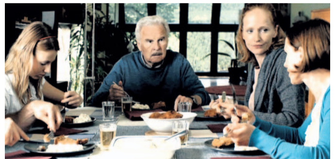
Nevinnost Na co zajít do kina? Třeba na nový film Jana Hřebejky Nevinnost.

Mělník KINO MĚLNÍK Mělník, náměstí 1, tel. 311 621 811 Nevinnost 18.30