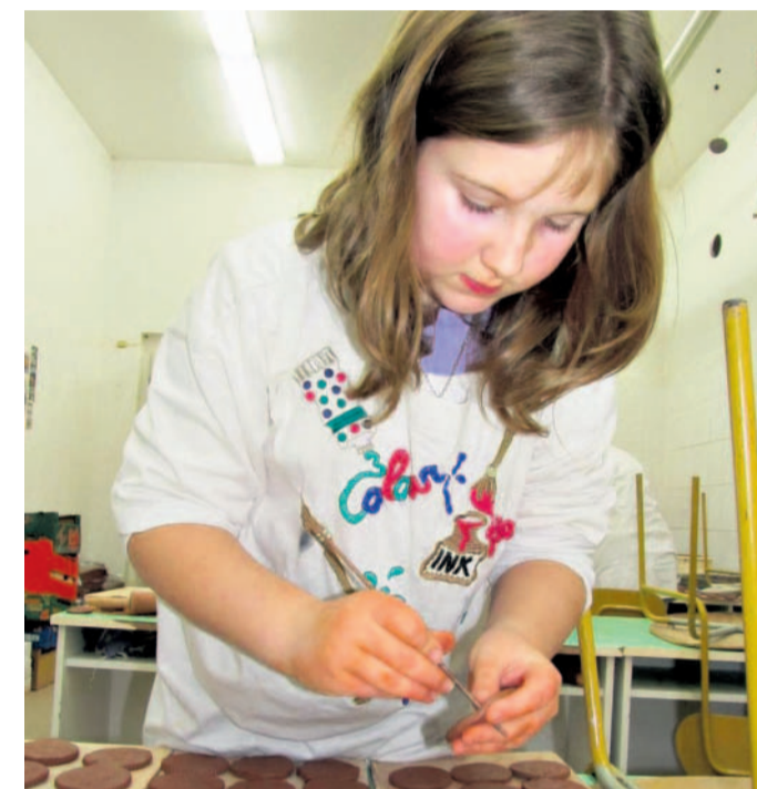
Zbývá jen dekorovat Každá z upomínkových plaket dostane mašličku, aby ji mohl majitel stále nosit.