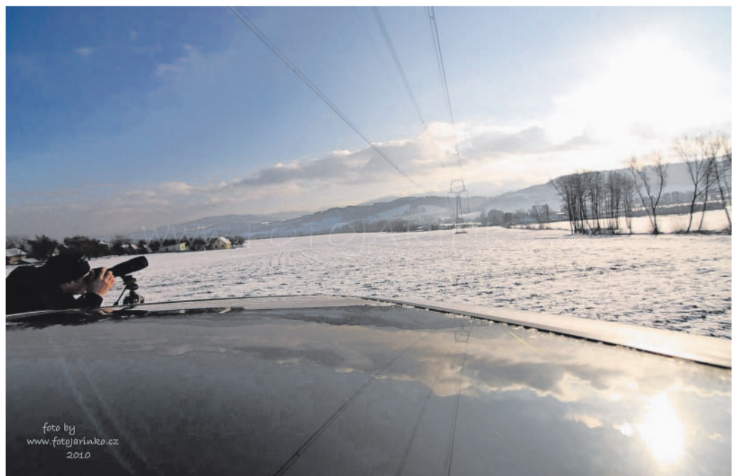
Frýdek-Místek Takto mohli lidé vidět v minulém týdnu zatmění Slunce nad Frýdkem-Místkem (foto vpravo nahoře a dole).