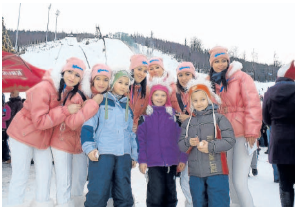
Tváře letů Tomáš Pečířka v Harrachově pod mamutím můstkem fotil fanoušky letů na lyžích.

MF DNES přináší čtenářské fotografie z internetového fotoalba rajce.idnes.cz. Dnes jde o snímky diváků, kteří o víkendu fandili letcům na lyžích v Harrachově