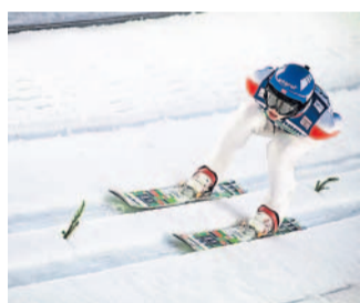
MF DNES přináší fotografie čtenáře Martina Kozáka ze Světového poháru v letech na lyžích, který proběhl o víkend v Harrachově.