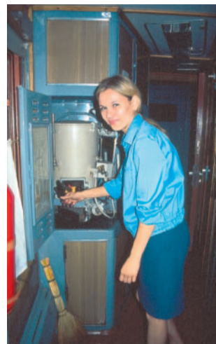
Samovar Zařízení, v němž se trvale udržuje vařící voda pro cestující, je v každém vagoně.