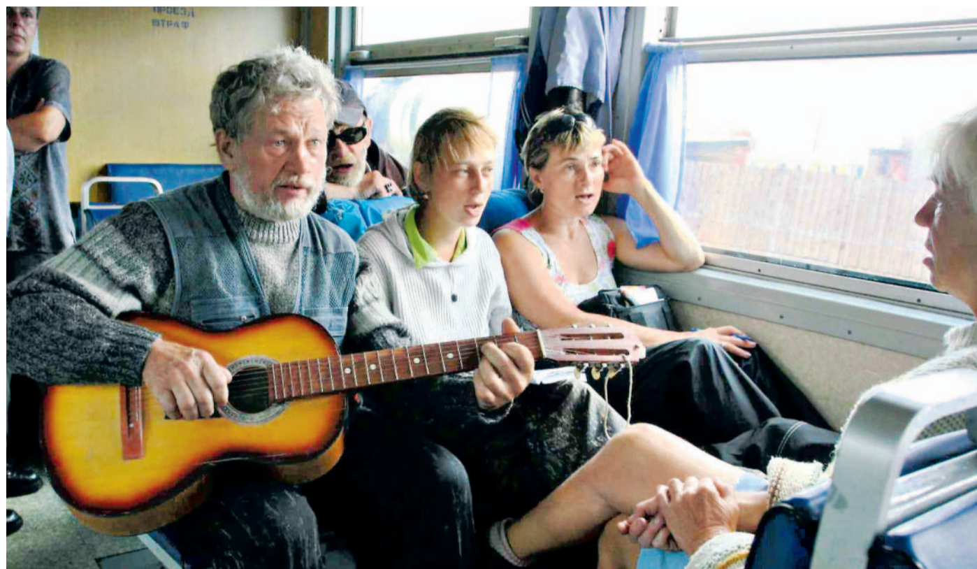
Rozptýlení Dlouhou chvíli na nekonečných cestách vlakem přes Sibiř si lidé krátí i společným zpěvem.

13. ledna: Sibiř (17 a 20 hodin) 14. ledna: Sibiř (17 hodin) 15. ledna: Sibiř (17 hodin) 17. února: Irsko 1 (17 a 20 hodin) 18. února: Irsko 1 (17 hodin) 29. března: Irsko 2 (17 hodin) 30. března: Irsko 2 (17 a 20 hodin) 31. března: Irsko 2 (17 hodin) 1. dubna: Irsko 2 (17 hodin)