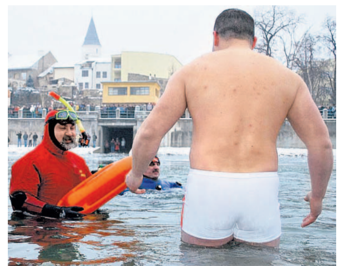
Davy lidí Na březích Bečvy v Přerově přihlížely odvážlivcům ve vodě o teplotě kolem dvou stupňů tisíce diváků.