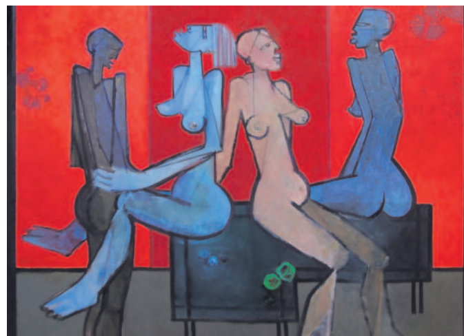
Osobitý rukopis Obrazům dominují rafinované promalovaná pozadí a hrdinové známých historických předloh.