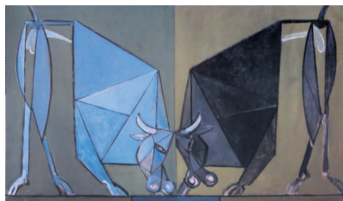
Poprvé na výstavě Kromě kreseb, grafik a objektů vystavuje Zdeněk Vacek v galerii i oleje, které namaloval během posledních pěti let.