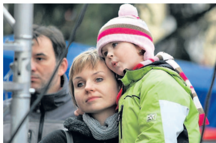
Autorka: Hana Křížová