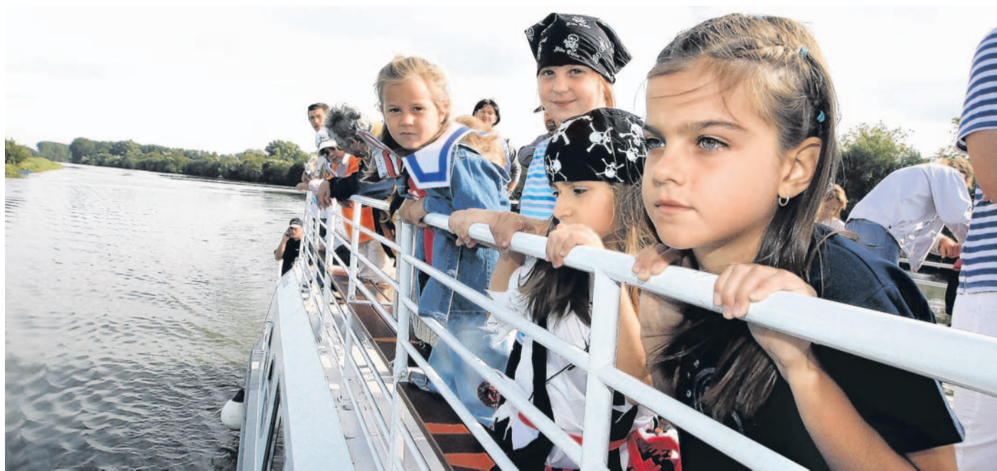
Kroměřížský přístav daleko Se stavbou mola v Kroměříži by se mohlo začít v roce 2012. Zatím kanál navštíví 65 tisíc lidí ročně.