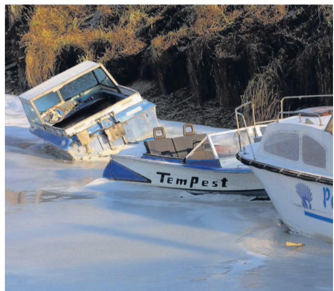
Ledborce chybí Zima občas zaskočí i jachtaře na Batově kanále, kteří své čluny zapomněli zavčas vytáhnout na břeh.