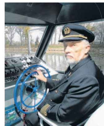
Námořníci na Moravě Po průplavu jezdí malé bárky, menší jachty i výletní parníky. Před dvěma lety začala vody kanálu brázdit loď Morava. Od otevření nového plavebního úseku do Kroměříže si politici slibují rozvoj cestovního ruchu.