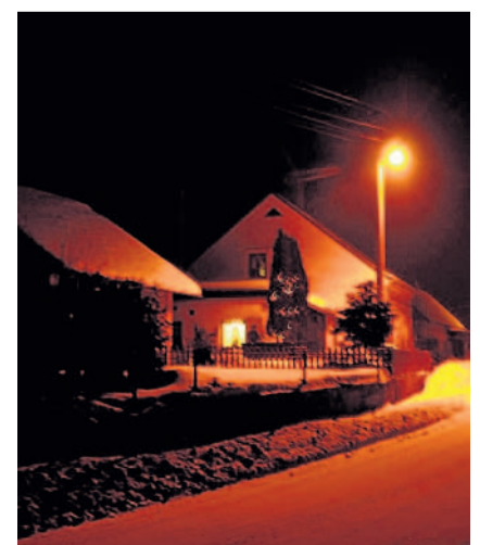
VÁNOČNÍ ZPÍVÁNÍ V kostele sv. Petra a Pavla v Bernarticích měli vánoční zpívání.