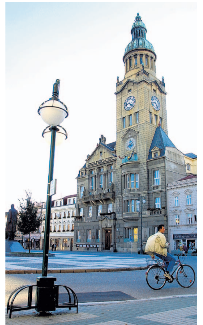
Milionová věž Za opravy věže vydá město šest milionů.