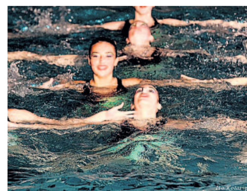
Kolem světa Vánoční vystoupení akvabel olomouckého oddílu synchronizovaného plavání SK UP se neslo v duchu tématu Cesta kolem světa.