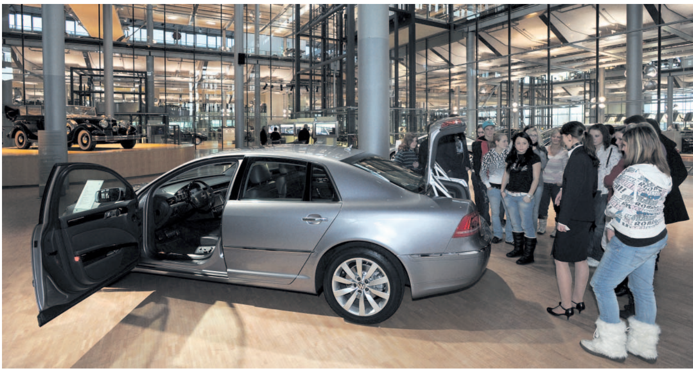
Exkurze ve Volkswagenu Drážďanský závod automobilky Volkswagen láká turisty na prohlídky s výkladem v českém jazyce.