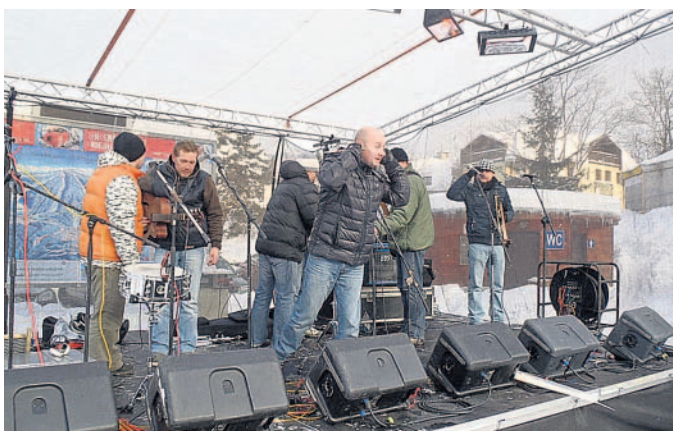
Začátek sezony v Harrachově Vystoupení skupiny Děda Mládek Illegal Band u lanovky v Harrachově zahájilo lyžařskou sezónu.