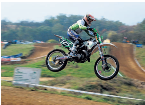
Na trati V Přerovské roklí se o víkend jelo Mezinárodní mistrovství České republiky motokrosu družstev 2010.