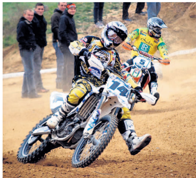
Klop to, klop to... Závod tradičně uzavírá domácí motokrosovou sezonu.

Vyhrajeme? V Přerově se sešlo patnáct tříčlenných týmů.