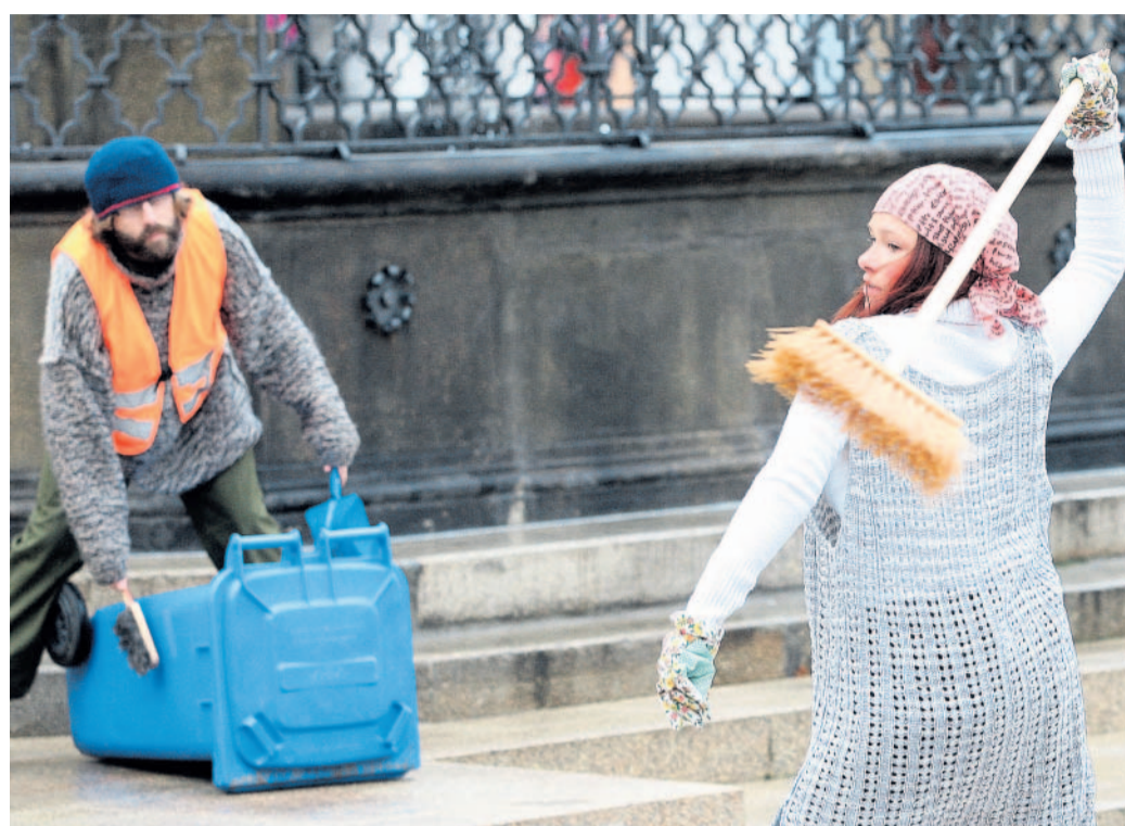
Umění v ulicích Festival Velká inventura v Liberci zahájil happening v centru města.

Zmíněným objektem je zdevastovaný novobarokní kostel svaté Máří Magdalény v Jungmannově ulici nedaleko soudu. Dnes v osm