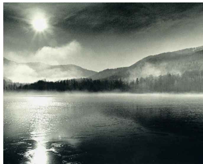
Mrazivé ráno