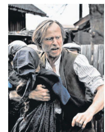
V novém filmu Juraje Herze hraje Karel Roden.