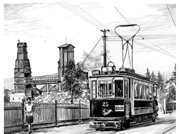
Stará Vápenka Spojení kouřících komínů a tramvaj vyvolává industriální nadšení i dnes.