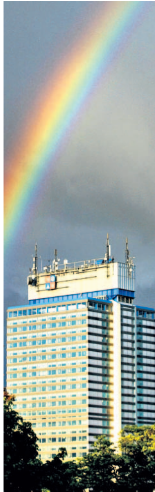
Přestavba bývalého výzkumáku na sídlo kraje se stala jedním z mnoha příkladů navýšování cen staveb.