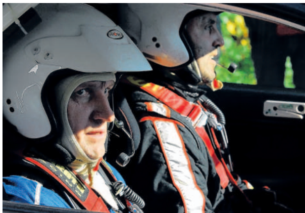
AZ pneu Rally Jeseníky Předposlední podnik mistrovství České republiky v rallysprintech se uskutečnil v okolí Šternberka.