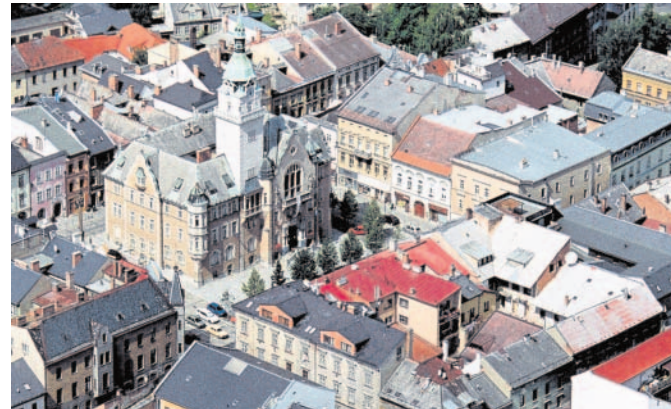
Závěrečné setkání Šumperská radnice na závěr volebního období také pořádá setkání zastupitelů šéfů odborů městského úřadu a ředitelů organizací propojených s městem.

Jesenický starosta v tom nevidí problém. „Už dlouho koalice říká, že chceme, aby o projektu rozhodovalo nové zastupitelstvo a tak to