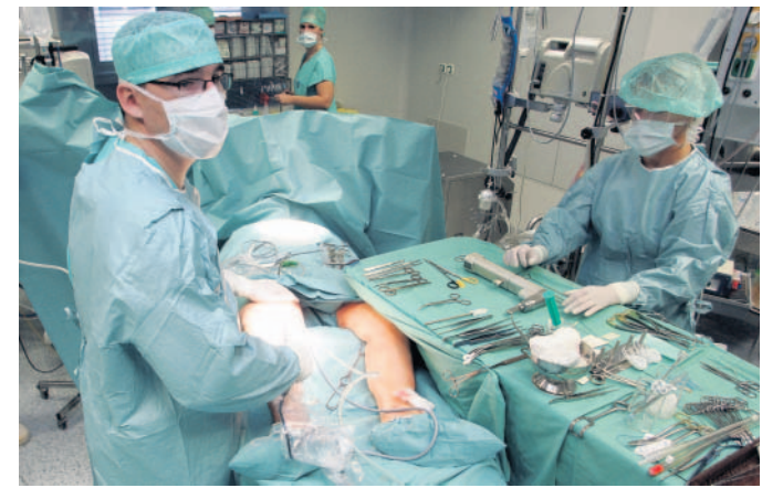
Změna Jesenícká nemocnice se zřejmě už na přelomu roku změní z privátního na neziskové zařízení. Důvod? Majitelé tak chtějí dosáhnout na evropské dotace.

» ad Z nemocnice bude neziskovka, MF DNES, 13. října