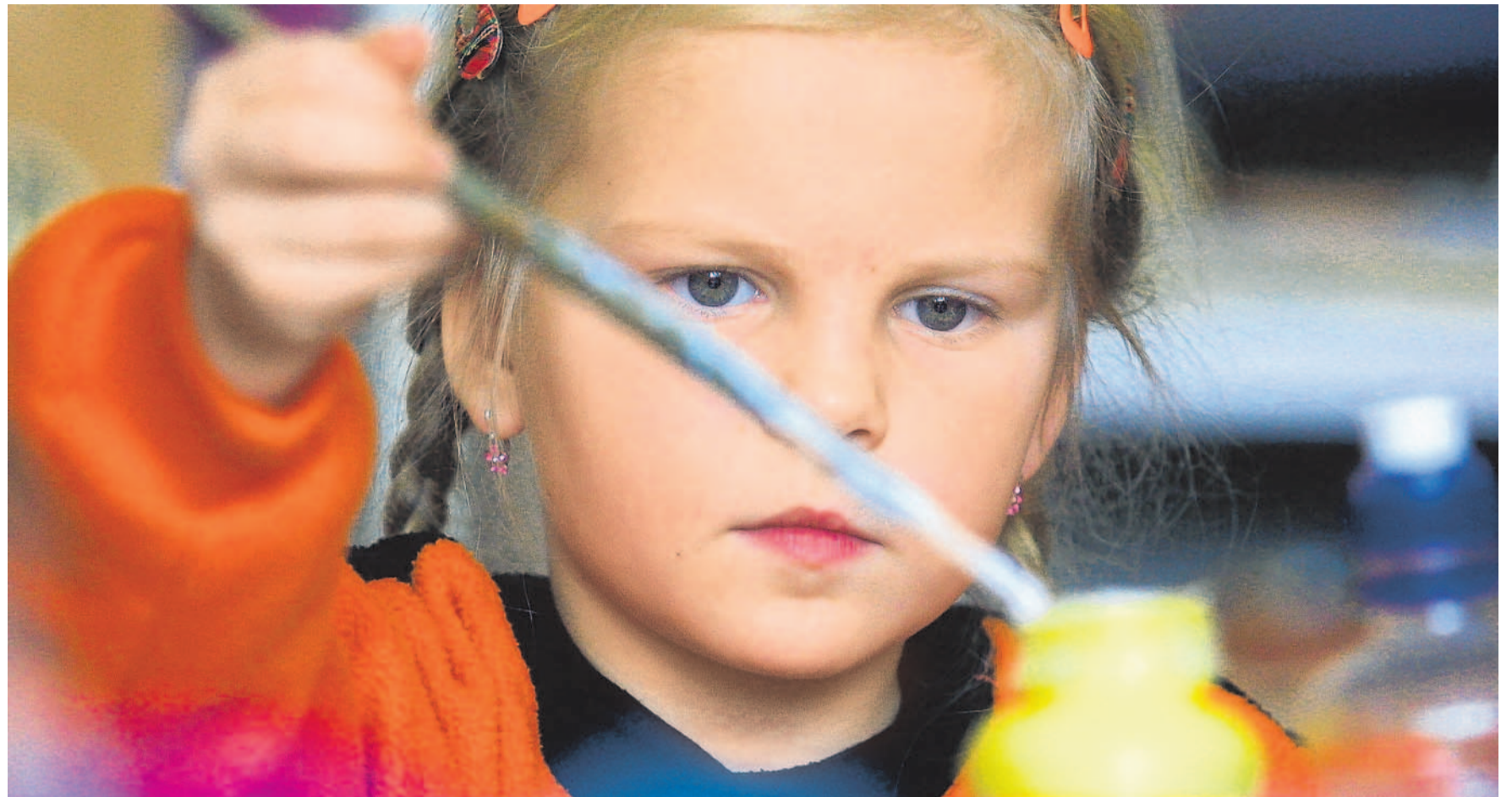
Učení hrou Domovy dětí mají ve své pestré nabídce jak sportovní kroužky, tak i třeba keramiku nebo malování. K umění se je snaží přivést hrou formou.

Většina kroužků startuje od 13. září, rodiče s dětmi se mohou hlásit