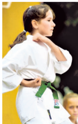
O nové žáky stojí v září také klub karatistů.

příprava, kontakt: 606 394 004, www.fkjablonec.cz, zápis proběhne 16. září na Střelnici ve fotbalové Chance aréně od 17 hodin, cena: měsíční příspěvek 500 Kč.