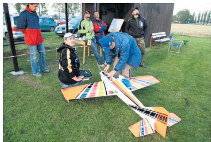
Přes nepřízeň počasí Ani silný vítr nezabránil v uspořádání Mistrovství České republiky v kategorii rádiem řízených akrobatických modelů kategorie RCA. Víkendových závodů na letišti Leteckomodelářského klubu Třebíč se zúčastnilo 16 soutěžících z celé republiky. Ti si rejů svých malých strojů dokonale užívali.