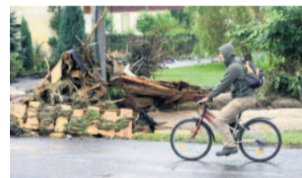
Trosky všude trosky a nepořádek. Tak to nyní vypadá v Heřmanicích.