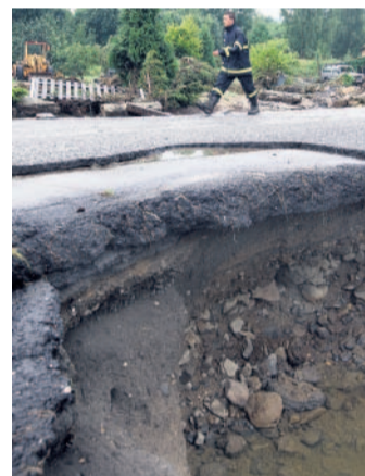
Tady byla silnice Zničené jsou také silnice, oprava potrvá hodně dlouho.