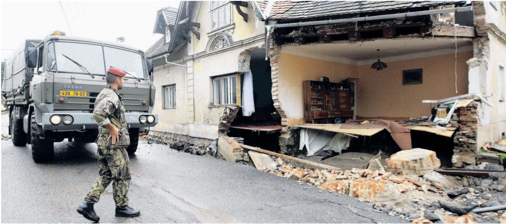
Obraz zkázy Lidem v Heřmanicích na Frýdlantsku zbyly z domů jen zbořeniště. Některé domy obyvatelé po návratu dokonce vůbec nenašli.

Reportáž Jen hrstka hasičů pomáhala ve zdevastované obci Heřmanice na Frýdlantsku likvidovat následky povodně. Lidé zůstali odkázáni sami na sebe