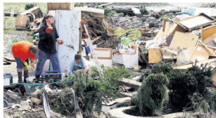
Čas na úklid Když voda v postižené obci opadla, nastal čas na úklid a sušení. Práce je všude dost.

Některé se neubrání slzám. Teprve teď na ně doléhá hrůza, již prožili, a práce, co je čeká. „Všechno jsme měli dole v přízemí. Je to pryč. Auto ani pračku jsem ještě nedoplatila, nemáme počítač. Zůstalo jen to, co měly děti v horním patře v pokojíku. Hlavně, že jsme tu v tu chvíli