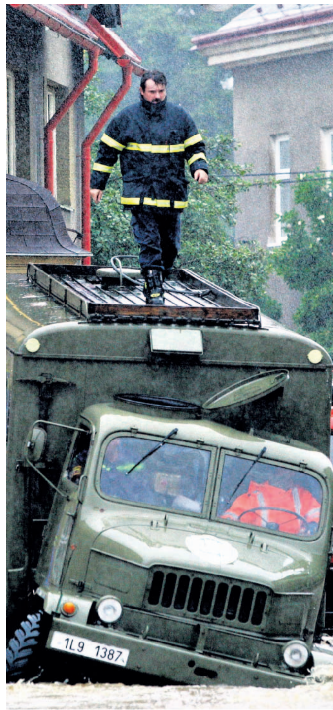
Chrastava Hasiči pomáhají v Chrastavě.

Hasičský záchranný sbor Libereckého kraje