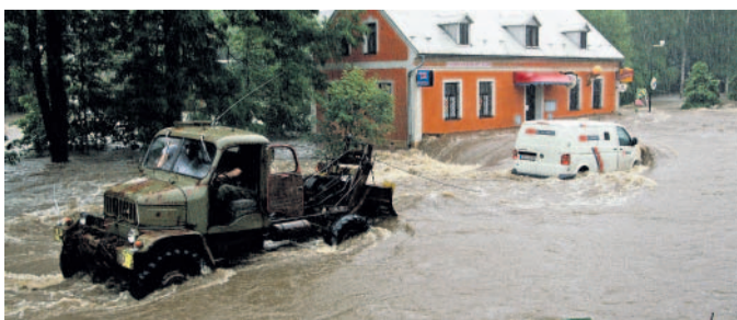
Peníze na vodě Dodávku vytáhla „větřieska“.

Pracovníkům se mimo proud podařilo otevřít dveře. Dodávku ale nedokázali nastartovat, voda natekla i dovnitř. Zda proud nepoškodil převážené peníze nechtěl ani jeden z mužů komentovat.