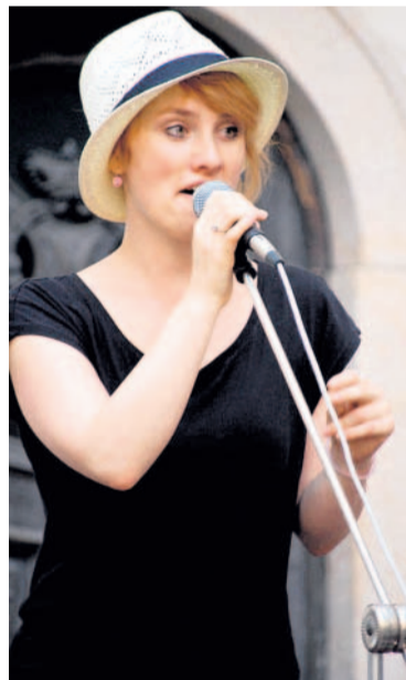
Jananas Festival Muzika pro Karolínu pořádá sdružení Ulita na blanenském zámku každou středu.

Vaše fotografie zachycující aktuální události na jihu Moravy se mohou objevit i v novinách. Účet si můžete založit zdarma na www.rajce.net .