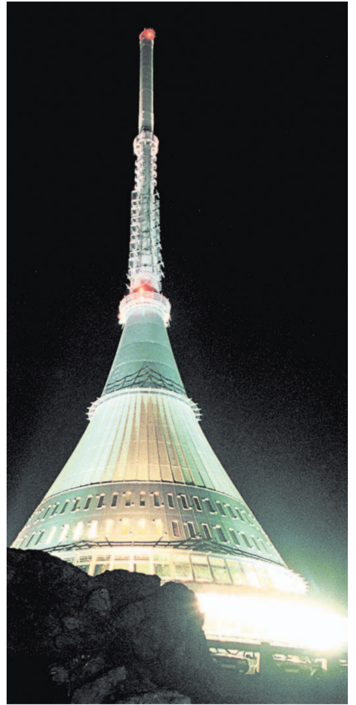
Oslavenec Festival na Ještědu připomíná jeho slavnostní otevření v červenci třiašedesátého roku.