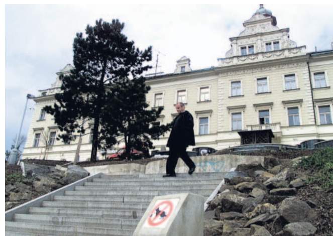
Vršovický zámček Opravy objektu začnou v červenci. Kromě bydlení pro seniory tady bude i obřadní síň.

„Zahájení prací je nyní naplánováno na 1. července, termínem