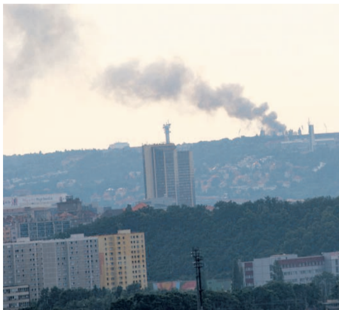
V plamenech skončila bývalá ubytovna v Běžecké ulici na Strahově.