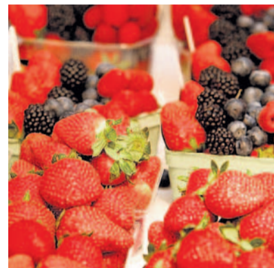
Barvami léta se v těchto dnech mohou těšit obyvatelé metropole.