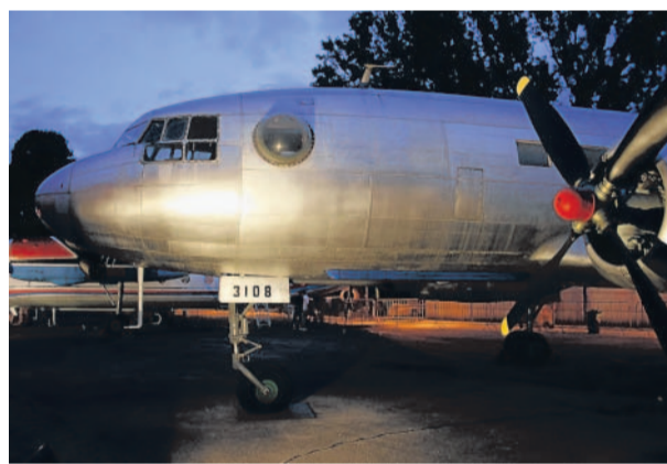
Ze soboty na neděli mohli v průběhu Pražské muzejní noci obdivovat návštěvníci i exponáty Leteckého muzea v pražských Kbělicích.

Vaším objektivem Výběr z fotografií čtenářů na serveru www.rajce.net, které přinesly poslední dny. I vy můžete své snímky představit na tomto webu a na stránkách MF DNES.