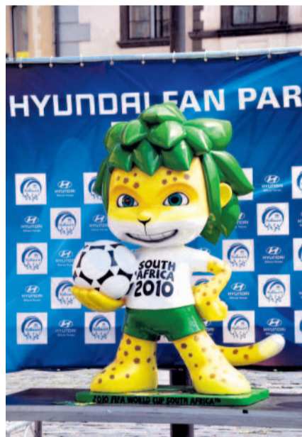
Maskota šampionátu ve fotbale mohli obdivovat návštěvníci Staroměstského náměstí.