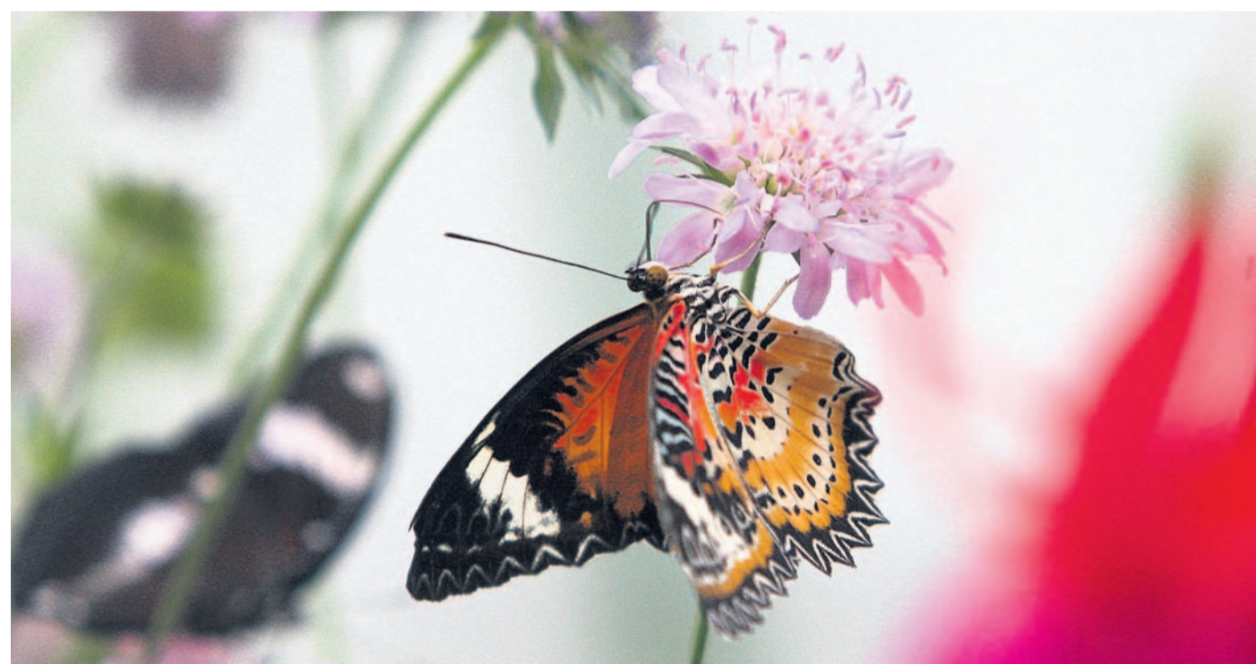
Škála barev V arboretu je k vidění kolem padesáti druhů motýlů, které člověk v našem podnebném pásu nemá šanci vidět.

Co se týče rozměrů, zajímavý je i motýl Attacus atlas z Indomalajské oblasti. Jedná se totiž o jednoho z největších motýlů na světě. Rozpětí jeho křídel dosahuje třiceti centimetrů.