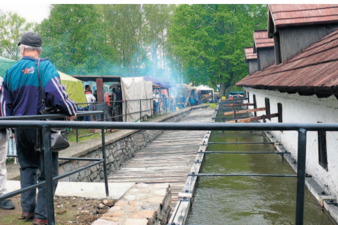
Unikát Akci hostí zdejší historický hamr, který se stal v kraji první národní kulturní památkou ze světa techniky.

Dílo Práce kovářů si mohli v sobotu prohlédnout návštěvníci tradičního Hamernického dne v Dobřívě na Rokycansku.