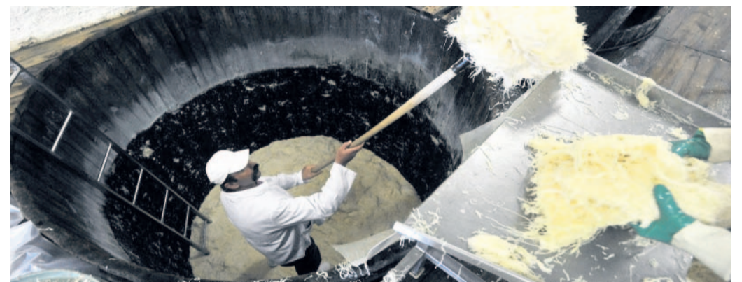
Ušlapáno Zelí se právě stěhuje z kádě do další části provozu.