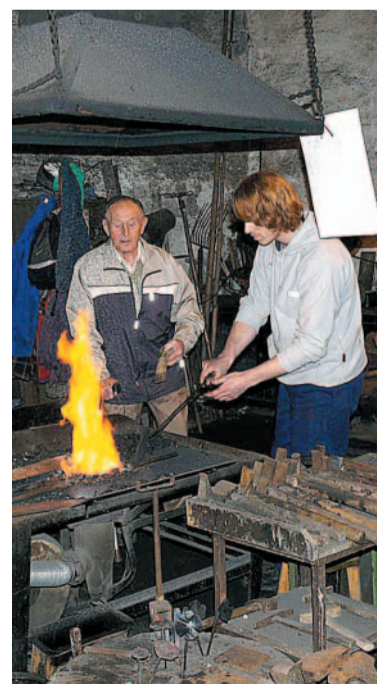
Pokus Zájemci měli možnost vyzkoušet si své kovářské dovednosti.