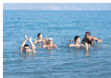
Letní počasí v listopadu Navíc jsme si při koupeli v Mrtvém moři vychutnali i drink (luzicka23)