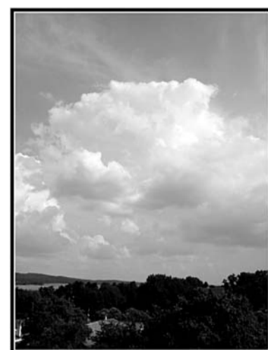
Blíží se bouřka Okolí Holyšova a Kvičovic na začátku letošního července (lukasw)