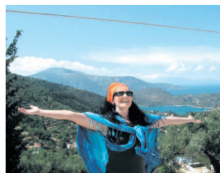
Hurááá lééééto Horká červnová dovolená v Recku (tmoravek)