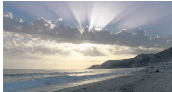
Schované slunce Červnový podvečer nad Středozemním mořem v turecké Alanyi (white-sally)