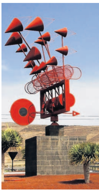
Větrohra na Lanzarote Na tomto ostrově sice často fouká, ale teploty jsou celoročně příjemné (lendast)