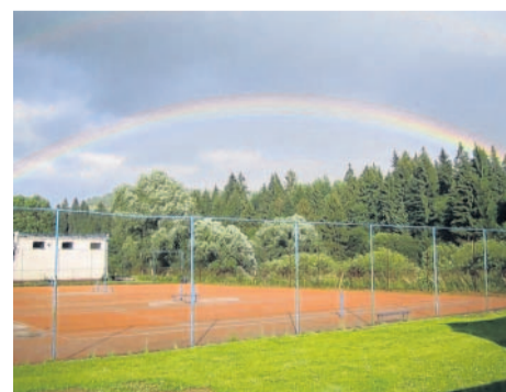
Duha nad kurtem Předložský červenec v okolí slovenských Roháčů (filipka)