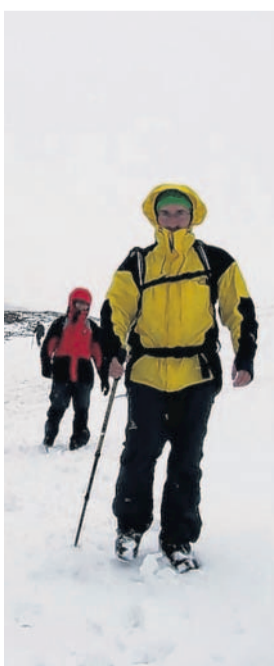
Sníh na konci června Na výletě ve švýcarských Alpách. A pak že letošní zima byla krátká... (klasekpetr)