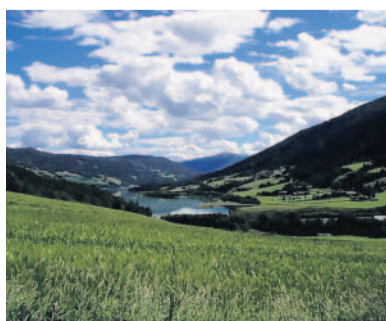
Mraky nad údolím Loňský červenec u řeky Otta v Norsku (mech)