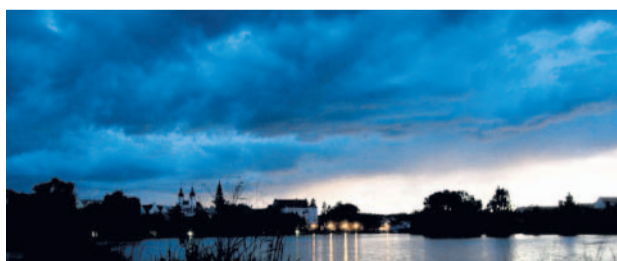
Kumuly nad Telčí Červnový podvečer, nad městem se objevily čarokrásné mraky (kanja)