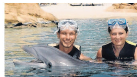
Discovery Cove Plavání s delfíny na Floridě (habakkuk)