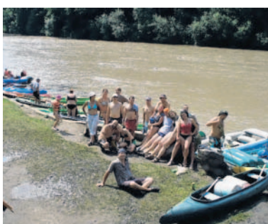
Chvilku neprší Skupinové foto z letošní červencové dovolené na Ohři (petrabrozka)